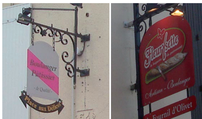
^ Exemples d’enseignes en drapeau autorisées