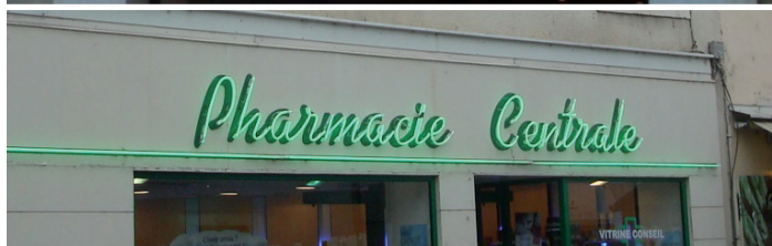
^ Exemples d’enseignes autorisées