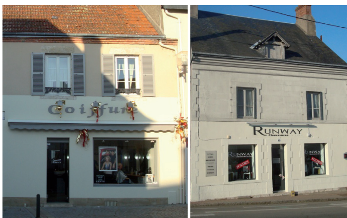
^ Exemples de devantures "en feuillure" : deux devantures inscrites dans l'emprise des percements

L'implantation trop haute de quelques enseignes sera à revoir ainsi que certains modèles non autorisés, tels que les blocs lumineux. L'accumulation d'enseignes pour une même devanture devra être réduite au minimum autorisé.