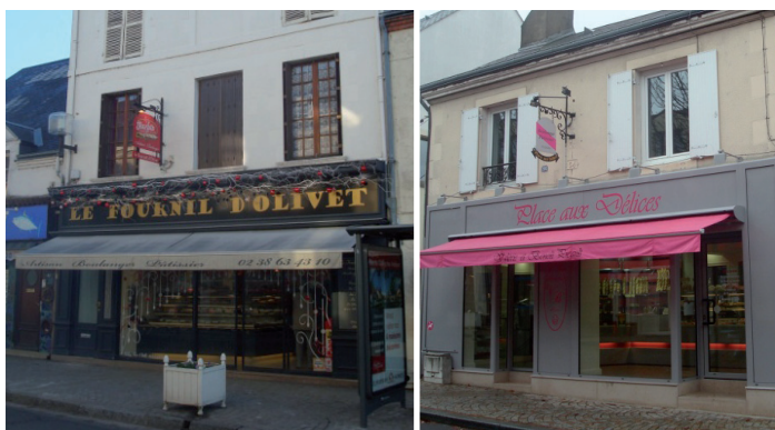
^ Exemples de devantures "en applique"